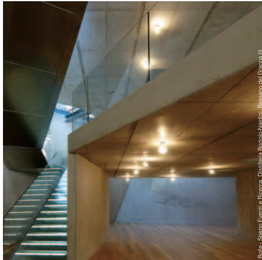
Bolle - Spazio Eventi e Ricerca. Distilleria Bortolo-Nardini, Bassano del Grappa (I)

3358.. CR-G-NS with telescopic stem and glass diffusers R3086/1S optional aluminium reflector