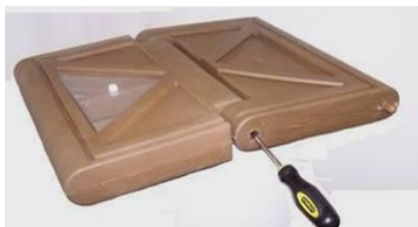
Unscrew right hand hinge bushing with phillips screwdriver